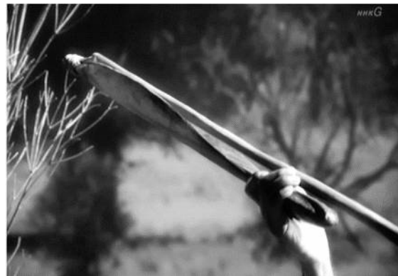
図2 投擲具（アボリジニの“ウーメラ”） NHK放映：ヒューマンより

「前頭野」が大きいこと、また成長の遅れと長命化を指摘します。これは、社会生活に適応するためのことばにかかわる様々な文化の習得や伝達を可能にしたとしています。